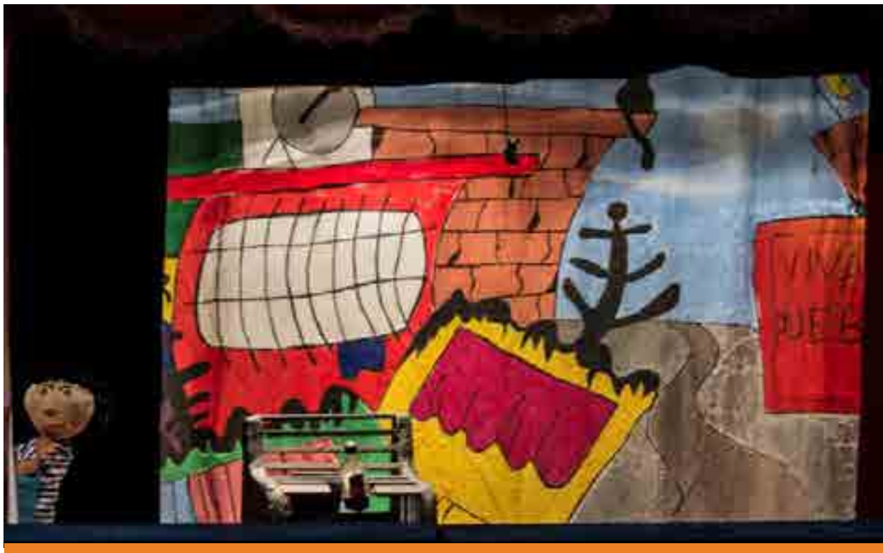
El pequeño limpiabotas. 2015. Teatro y Títeres Cantalicio UCV

humanidad y sentimientos que exhortan a una convivencia que se coloca a la par de la armonía y la rectitud de la vida.