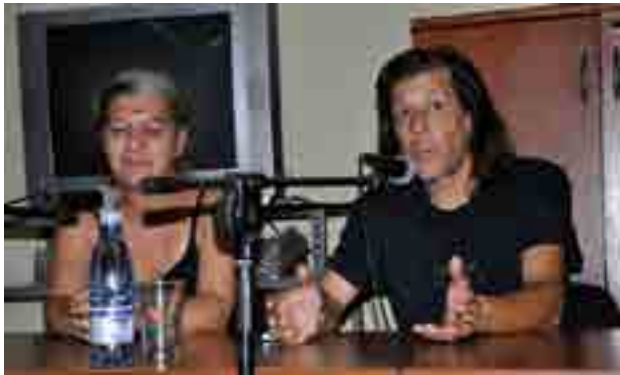
Integrantes de Museo Vivo