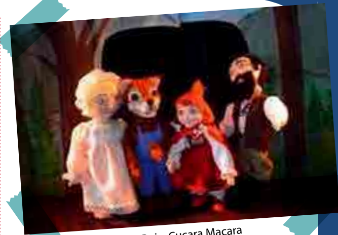
Caperucita Roja. Cucara Macara