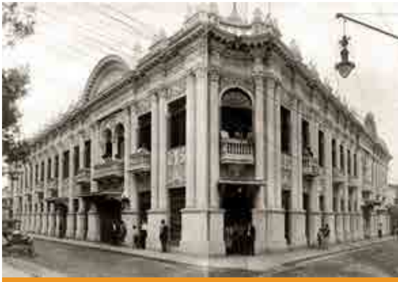
Teatro Melico Salazar

De lujo será el espacio de encuentro, nada más y nada menos que el Teatro Popular Melico Salazar, diseñado por José Fabio Garnier, dramaturgo y arquitecto, edificio fundado en el lejano 1928, del siglo XX. Uno de sus acogedores salones servirá de espacio para las tres sesiones de trabajo, donde se discutirá lo realizado hasta la fecha y la puesta en marcha de nuevos proyectos.