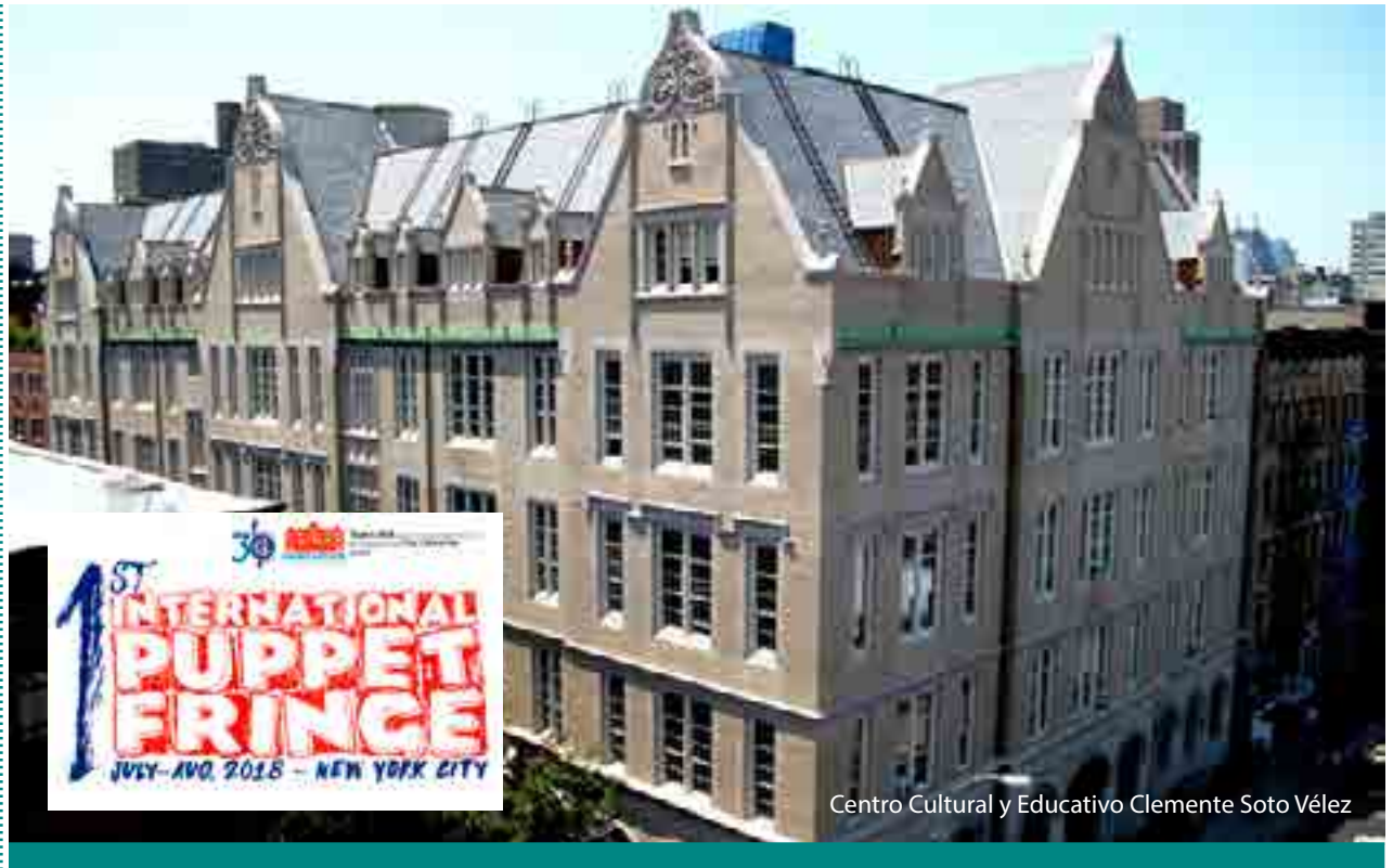
Centro Cultural y Educativo Clemente Soto Vélez

Esta primera edición tendrá como sede el Centro Cultural y Educativo Clemente Soto Vélez, en el Bajo Manhattan, en la Ciudad de Nueva York. El "Clemente" es una institución cultural puertorriqueña/latina, que ha demostrado una visión de mente amplia y una filosofía de colaboración. Si bien su misión se centra en el cultivo, presentación y preservación de la cultura puertorriqueña y latina, es igualmente un espacio multicultural e inclusivo, que sirve de sede a