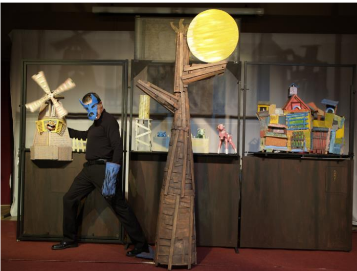
COLECTIVO HUMO - Navarra “Hambre de lobo” 28.11.13 – 11.00 y 14.00 – LEIDOR Público escolar concertado

Cuando el sol salía, el gallo cantaba. Entonces el campanero hacía sonar la campana de la iglesia. Y todo el pueblo se ponía en movimiento. Una tarde de otoño un benteveo se acercó a conversar con el gallo...: “Vives encerrado. Crees que todo empieza y termina en tu gallinero. ¡Y hay tanto que ver detrás de tu alambrado! Hay ríos, bosques, montañas, mar...”