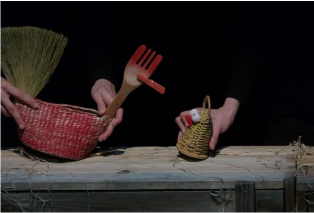
LA CANICA - Madrid “El gallo de las veletas” 27.11.13 – 11.00 y 14.00 – TOPIC Público escolar concertado

Era un gallo que vivía en un gallinero. Sus padres, sus abuelos, sus bisabuelos y sus tatarabuelos habían vivido siempre en ese mismo gallinero.